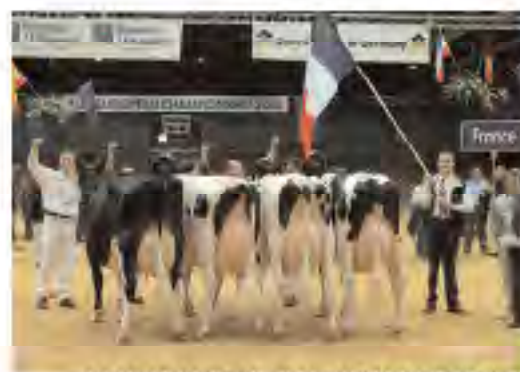
Le lot français victorieux à Oldenburg en 2008 Waco, Championne Adulte à Oldenburg en 2008

Venez soutenir les 15 vaches françaises !