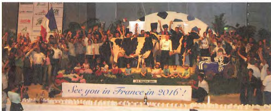
Candidature pour "Europe 2016".

Pour la clôture du National, les organisateurs du concours avaient prévu une jolie surprise. Lorsque Venus et la Championne Réserve, Bonheur, ont été positionnées sur le podium des championnes, il a été demandé au public de les entourer. De cette façon envoiaient-ils un message à l'Europe: «La France se désigne d'elle-même pour accueillir le Concours Européen 2016». Une clôture fantastique pour une manifestation dynamique qui méritait certainement davantage d'intérêt de l'étranger. ●