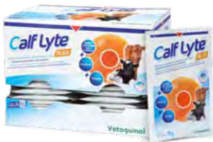
Sachet de 90 g