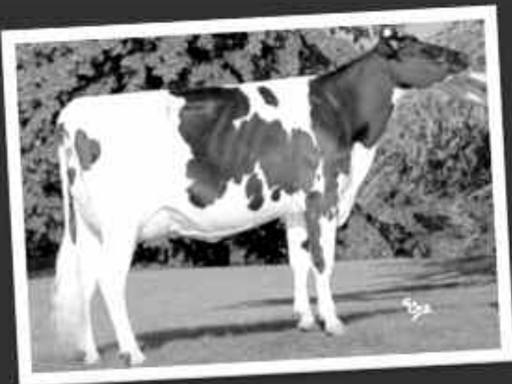
CAMERONE TB88 (BOLTON/RIVERLAND) Grand-mère de GITANE RM