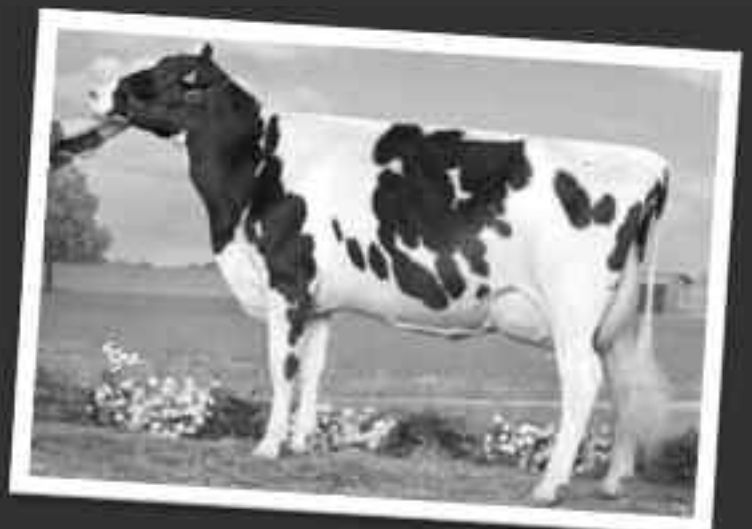
SAVOIE EX94 (GELPRO/GALDO) Tante de ETANE

Pour tous renseignements : Jérémie PEILLON 06.85.01.83.13 Jean-Marc THELISSON 06.07.66.96.49