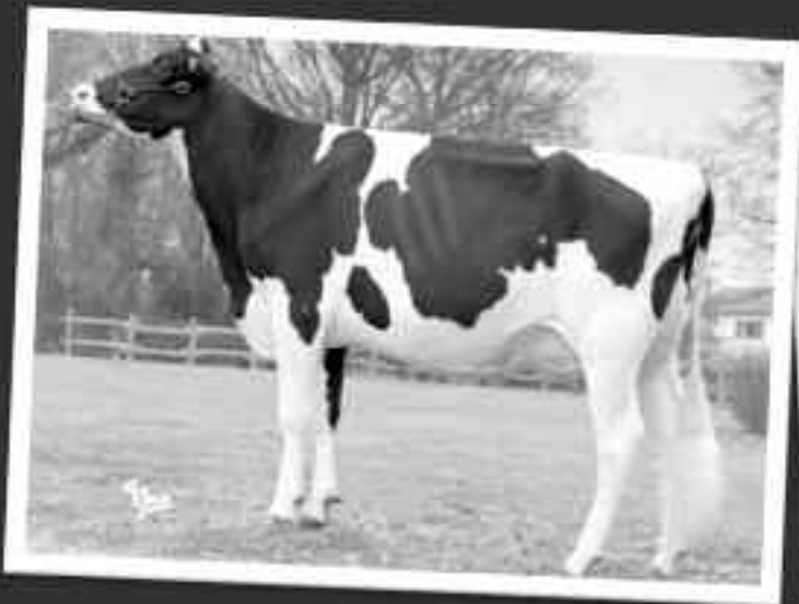
FAVI DABBI TB88 (GOLDWYN/MERCHANT) Demi-sœur de FAVI GULLY