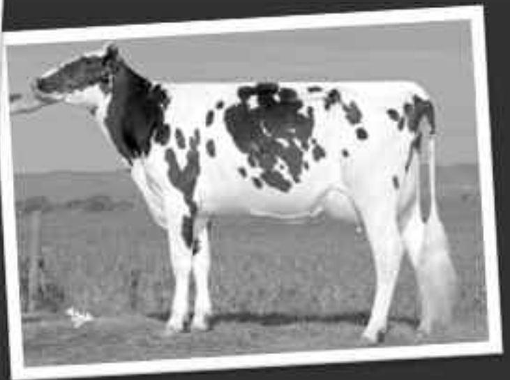
ANEE TB85 (SHOTTLE/LUCENTE) Grand-mère de GENIE POM