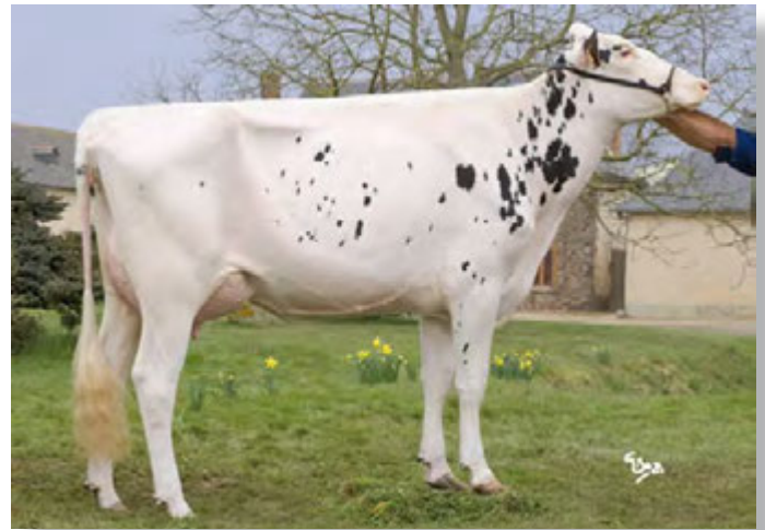
ALINE, grand-mère de GIPSY

Une Explode prête à collecter, petite fille d'Aline : une superbe morpho, un énorme potentiel