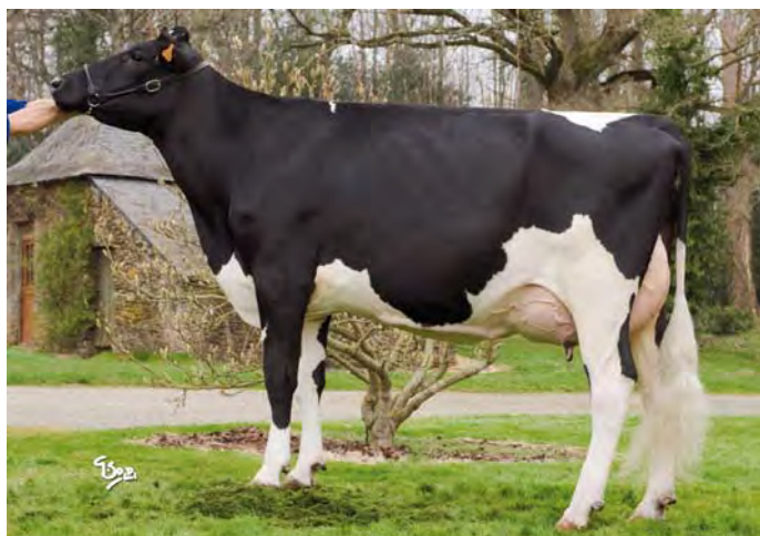
DAV ADDEEN, grand-mère de GALA ROF