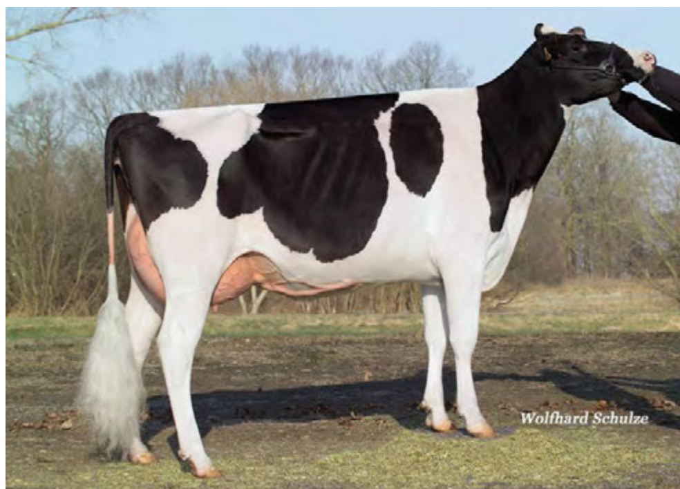
ETOILE, mère de GLIPSY