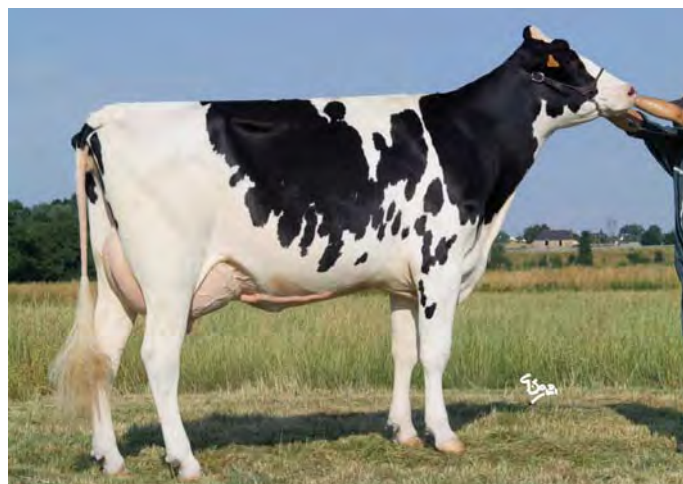
UNE ROLLS, mère de DANOISE