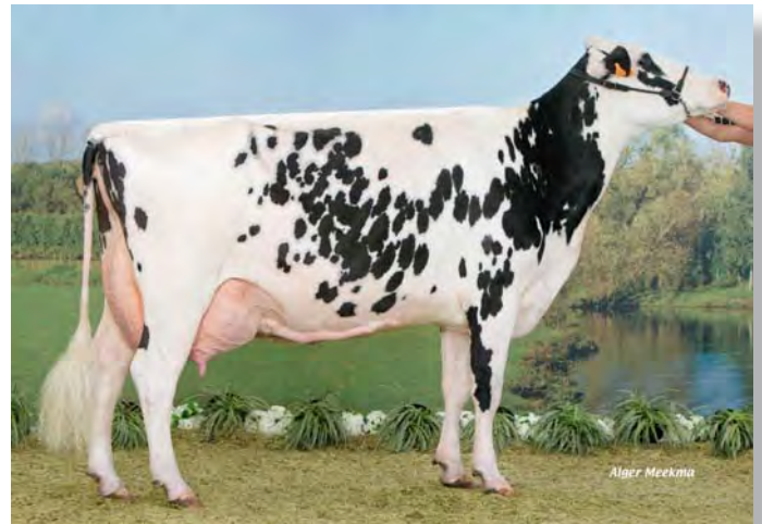
AGATE, grand-mère de GALAXIE

Probablement la seule Marcos d'une grande famille disponible à la vente. Fille unique, un rameau original sur la souche de la Jenga-Ehb