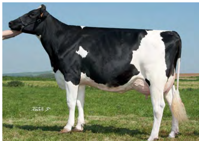
ESTA-SOCKO, mère de GESTABROOK