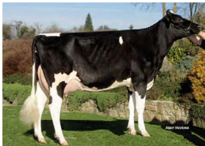
DAYLIGH, mère de GET-DAWN