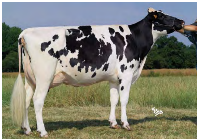
UPREME, arrière-grand-mère de GIRONDE