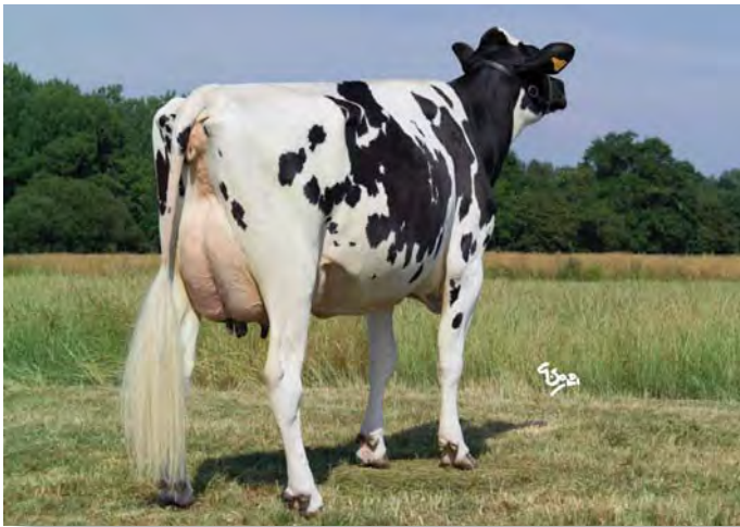
UPREME, arrière-grand-mère de GIPSY