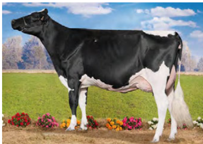
CYBELLE, grand-mère de GIRONDE