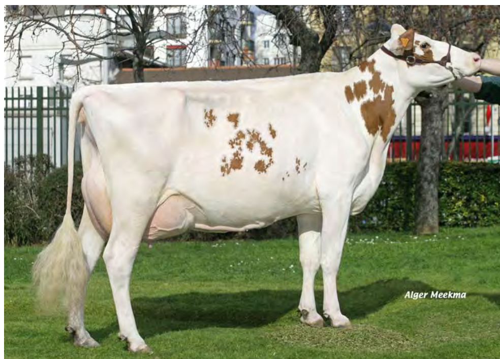
TIMA RED, demi-soeur de UMBA RED

Une famille avec des taux records et sans faille en morpho. Un pedigree différent en Red Holstein