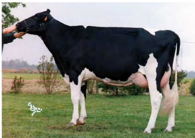
OLIVIA, arrière-grand-mère de DANOISE