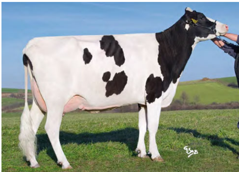
CAMPIONNE, mère de GRENADE BG