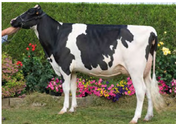
CREMONE, grand-mère de GIRL