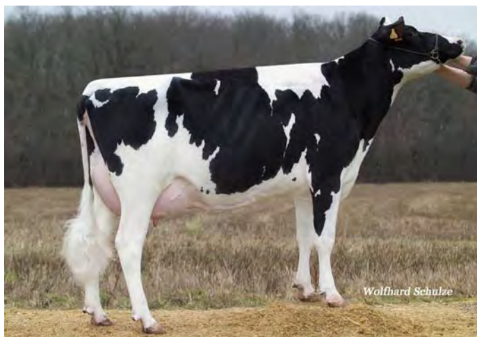
BERGINE, grand-mère de CAPGUIMOVE