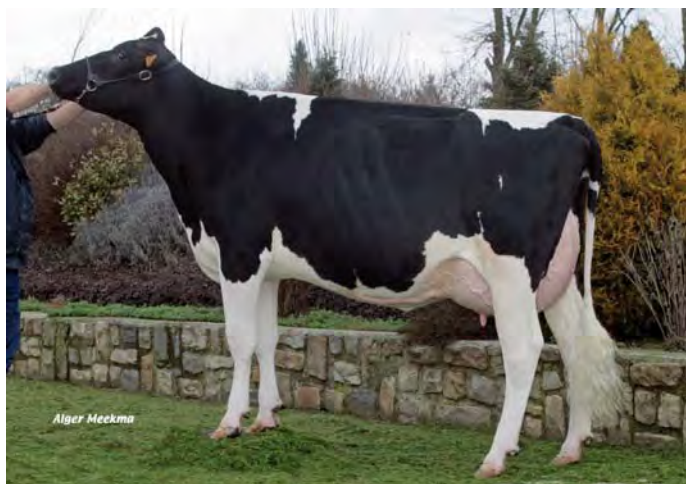
BACCARAT, grand-mère de GET-DAWN