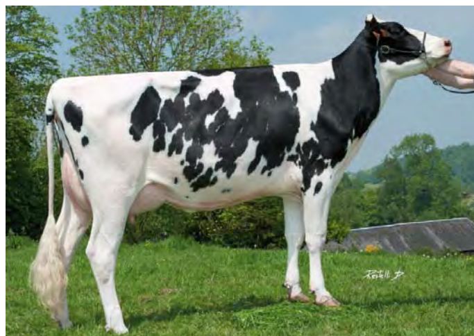
ESPACE, mère de GAELE et GELSTAR