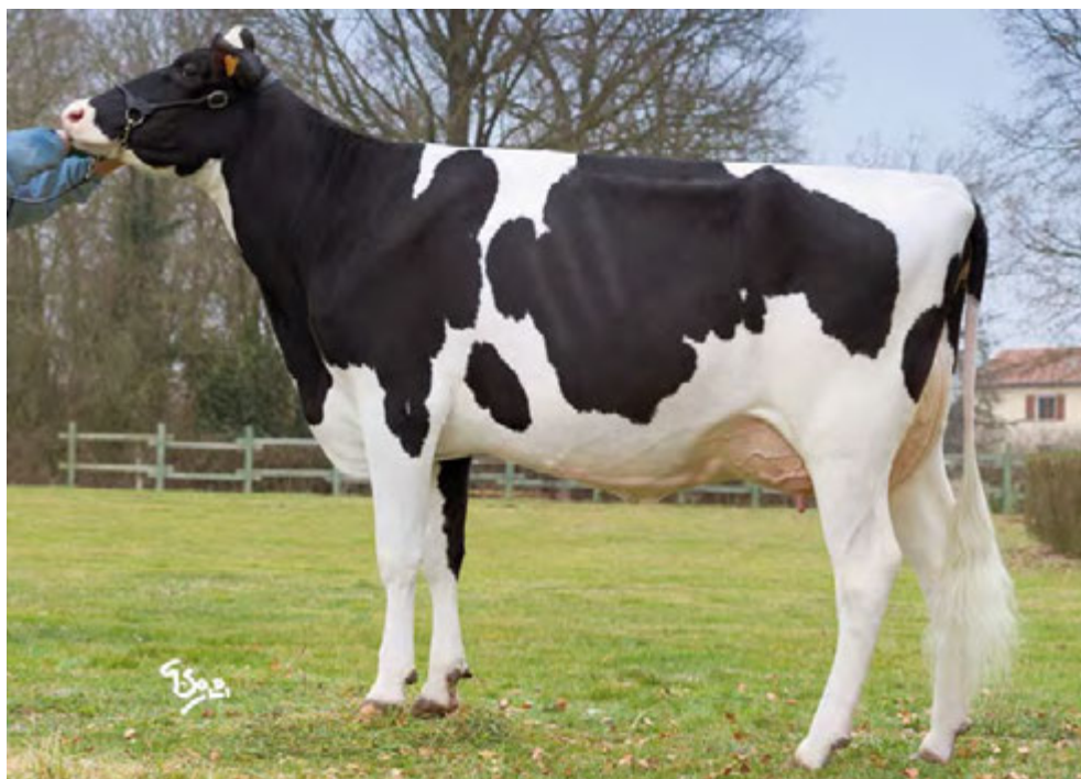
FAVI DABBI, mère de FAVI GWAPA

Un montage original + des bons index génomiques = une nouvelle famille avec déjà 5 générations TB ou EX