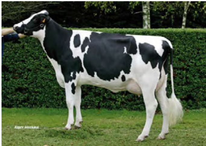
TAHITIENNE, arrière-grand-mère de GALAXIE