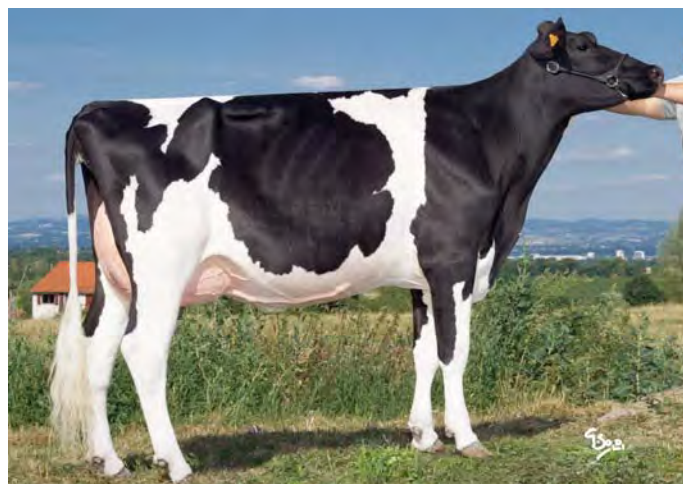
DAV-EILEEN, mère de GALA ROF