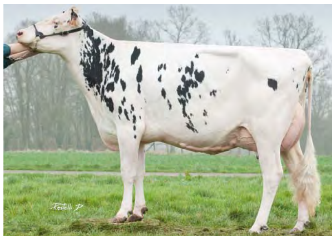
CAP DIVINE, mère de CAPGUIMOVE

La première fille de Snowman vendue en France, un pedigree sans Shottle, Goldwyn ou Jocko Besn, sur la célèbre souche Naurine