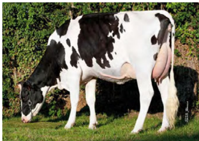
ELEGANTE, mère de GIRL

Une grande famille sans Jocko, Goldwyn ou O-Man avec du lait, de la santé et de la morphologie et 170 points d'ISU !