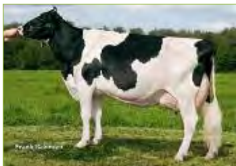
Gen-I-Beq Durham SUNSHINE TB-88 6*