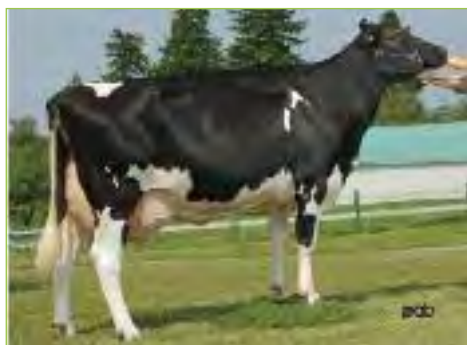
Gen-I-Beq Lee SPENDIDE EX-90-2E-CAN 12*