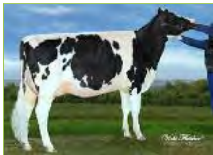
Stepido CROCKIE Dundee TB-86-CAN 2Y Demi-soeur de OUCH EPIDO

Pierre : 06 63 22 03 52 - Paul 06 71 67 65 37