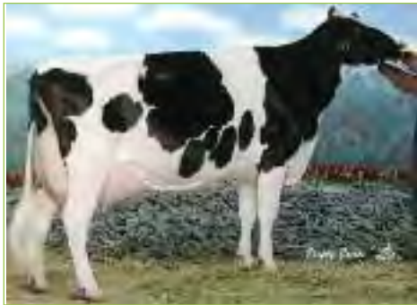
Dreane Astre INKSOU EX-96-4E-CAN 4*

Crackholm INOUK TB-85, Championne Espoir Régional Prim'Ho Centre 2010