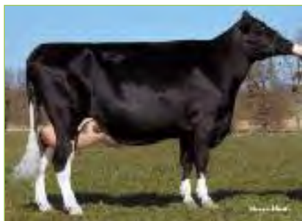
MISS TRIPLE EX-92