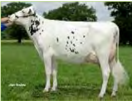
ADELIN TB-87 (88/86/84/86), pleine soeur de BARBARA