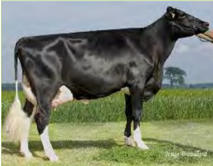
La Présentation BEATRICE TB-85-CAN 1*