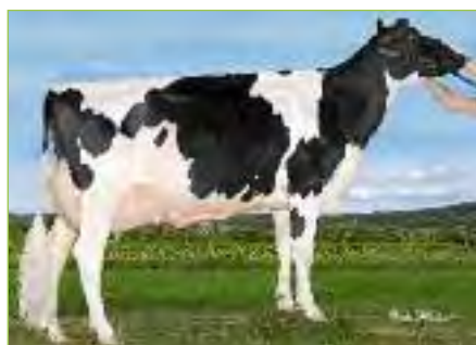
Stepido Redman GAIL TB-89-CAN Demi-soeur de OUCH EPIDO