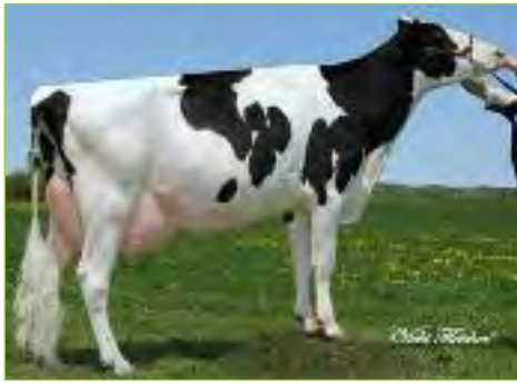
Crackholm ITALIA TB-89-CAN 4 ans