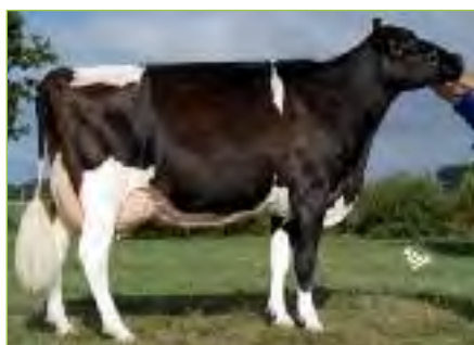
ODYSSEE EX-93 (p. JED) Fille de MISS TRIPLE