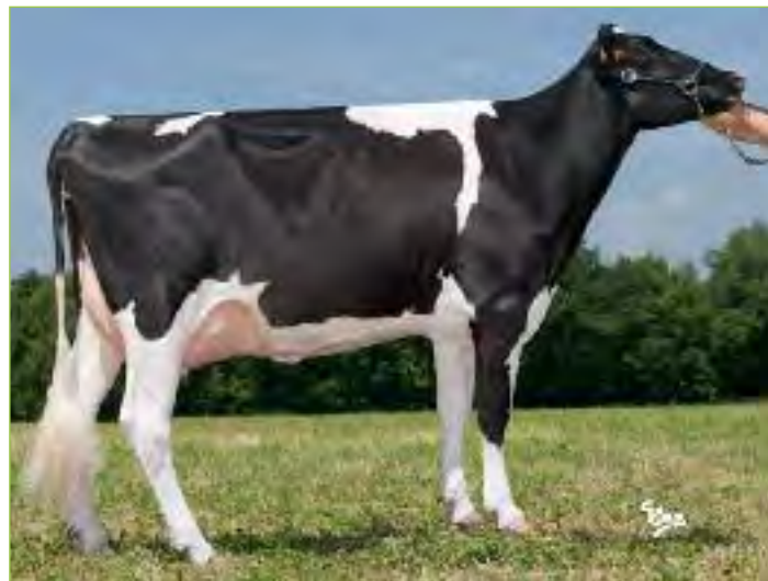
SPLENDIDE TB-85-FRA (86-81-86-84) @ 2-4