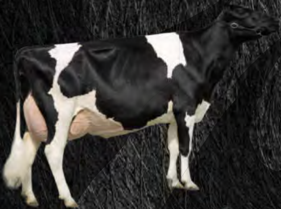
Lylehaven LILA Z EX94, Grand-mère d'ELILOZ DKR