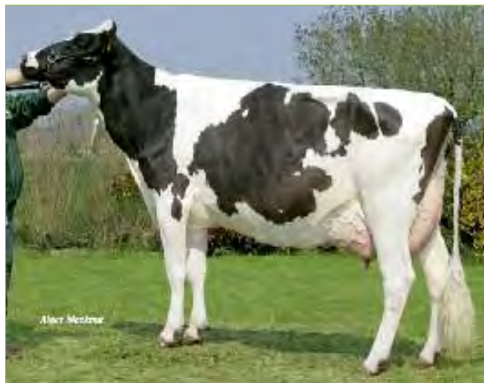
TAIRINE 1731 TB-87-FRA