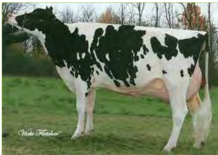
Stepido Outside GIRL EX-93-CAN 3*