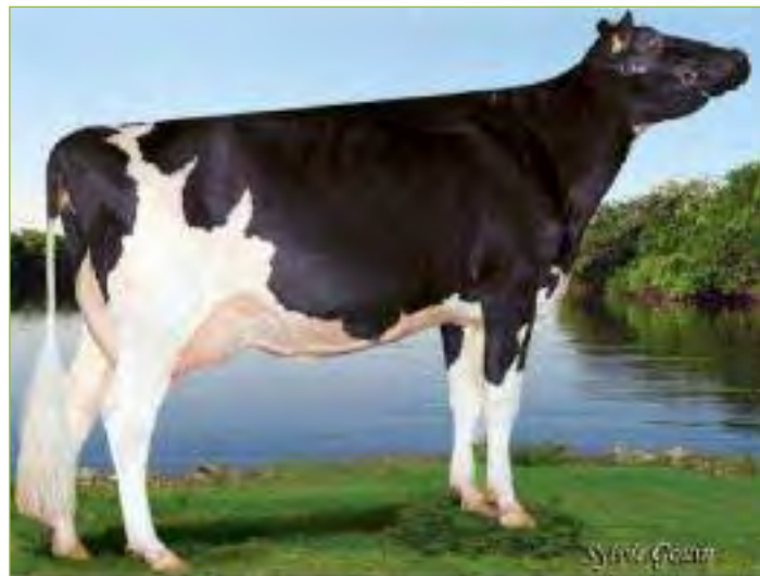
Gen-I-Beq Dundee SUPRA CVF TB-88-CAN