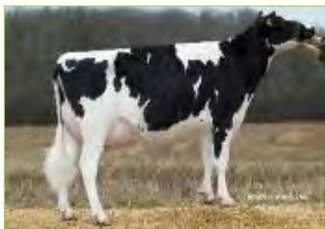
BERGINE BP-83 , soeur de CAREINE par MASCOL