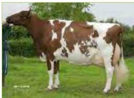
RUBIE RED EX-90

La Ville Es Chien - 22120 HILLION Arnaud 06 99 21 22 50 - Ludovic 06 62 55 77 50