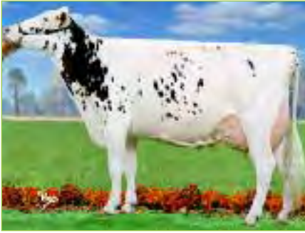
SALLE , pleine soeur de BARBARA, faisait partie du lot hongrois à Crémone

Les Jordannes - 42130 MONTVERDUN GSM 06 82 24 99 84 - Tél. 04 77 97 58 26