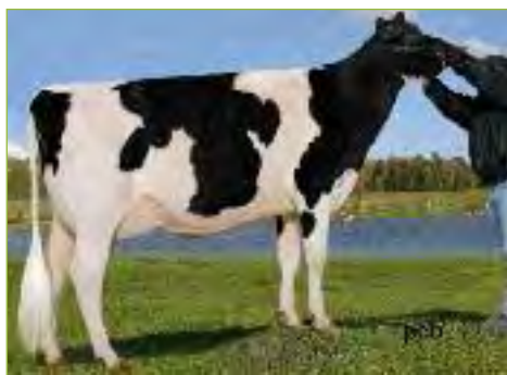
Belfast Bolton SUPRA TB-85- CAN, soeur mater- nelle de FLORIMIE

Hervé RUEL - GSM 06 09 99 44 30 - www.montregnierholstein.com