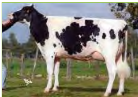
U SPENDIDE TB-86-FRA-NT