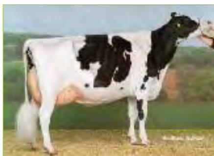
Decrausaz Iron O'KALIBRA BP-84 CH